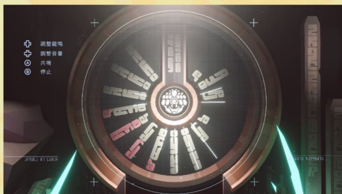
遊戲中的主要「解謎」環節。