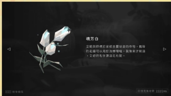
遊戲中的其中一個收藏道具。

而遊戲最重要的玩法其實是它的收集要素。這款遊戲有著數量不少的與主線無關的支線任務。玩家可能會被npc要求收集某樣物品，而這樣物品可能是支線的獎勵或者是某個商店裏的道具。而除此之外，正如劇情部分所說，大部分道具的描述都帶有一定程度對故事或者世界觀的背景和補充。這更是鼓勵著玩家去收集這些物品。