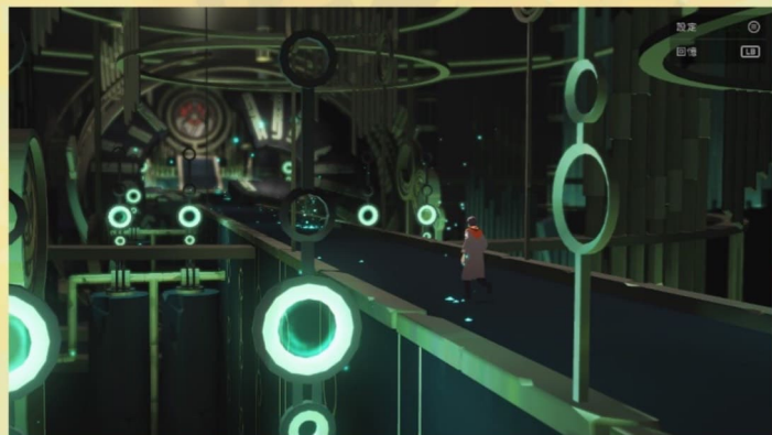
遊戲中的其中一個龍脈場景。

雖然《龍脈常歌》並不是以遊戲性見長，但作為一個劇情跟前作劇情相比毫不遜色的作品，在遊戲性上也做出了一定的進步，個人認為也已經算是足夠。